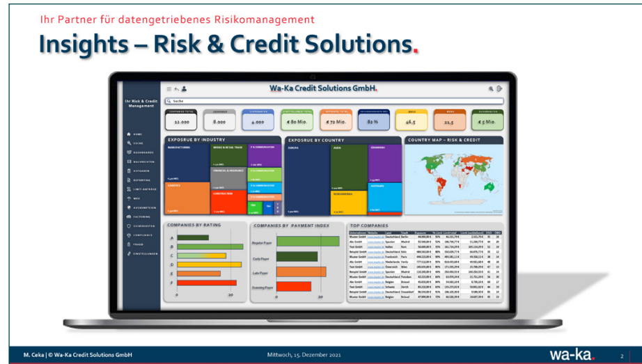
Das Risiko jederzeit im Blick – mit Hilfe einer High-End-Schnittstelle alle Vor- und Nachsysteme zuverlässig zentralisiert

MC: Die Herausforderungen sind vielfältig. Beginnend damit, aus dem eigenen Datenuniversum das richtige Extrakt für weitergehende Entscheidungen zu ziehen. Außerdem müssen sie die Trennschärfe heutiger Standard-Scores verschiedener Auskunftsteile erhöhen: Wie viele „orangene“ Risiken würden sich – angereichert durch Informationen aus dem eigenen Datenuniversum – in „grüne“ bzw. „rote“ Risiken verwandeln? Besonders herausfordernd stellt sich für viele Unternehmen der Flickenteppich der eigenen Systemlandschaft dar. Wie kann ich als Credit & Risk Manager die